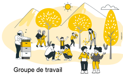
Groupe de travail Végétalisation des lieux éducatifs Ardèche

Pour la contacter : formation@petale07.org / 06 46 12 84 12